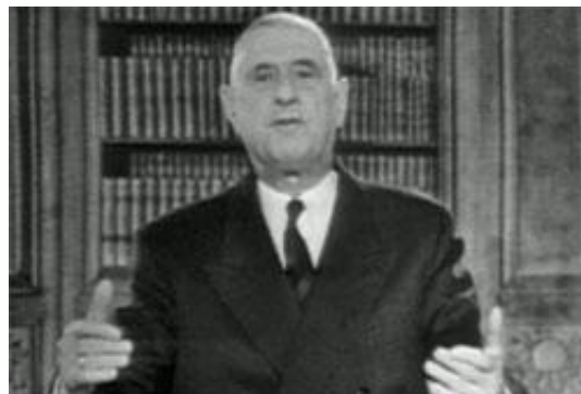
Charles de Gaulle v roce 1962

Nelze ovšem nezaznamenat, že generálova interpretace ústavy byla často poněkud originální . Pan Duverger například cituje jeho projev z 31. ledna 1964, kde mj. prohlásil: „ Musí být jednoznačně pochopeno, že nedělitelná autorita státu je celá svěřena prezidentovi republiky lidem, který ho zvolil, že neexistuje žádná jiná, ani ministerská, ani civilní, ani vojenská, ani soudní, která by mu nebyla udělena a nebyla jím držena (...) “. 102 Maurice Duverger k tomu dodává, že prezident zde poněkud pozapomněl na parlament, který je rovněž volen lidem – a zcela pominul i vládu. Já sama ještě dodávám, že tato věta je přímo ilustračním příkladem toho, že obecně uznávané rozdělení moci na zákonodárnou, výkonnou a soudní a nutnost jejich vzájemné nezávislosti a rovnováhy tak docela netvořily součást de Gaullovy představy o fungování státu.