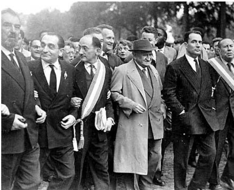
Demonstrace za zachování republiky Pierre Mendès France stojí druhý zleva, François Mitterrand druhý zprava.

28. května se Mendès France účastní spolu s dalšími předáky levice včetně Mitterranda protifašistické demonstrace v Paříži – protestují proti převratu v Alžírsku – a proti tomu, aby vláda povolila vzbouřencům. Tehdy vyjde do ulic na 200 – 250 30 tisíc Pařížanů.