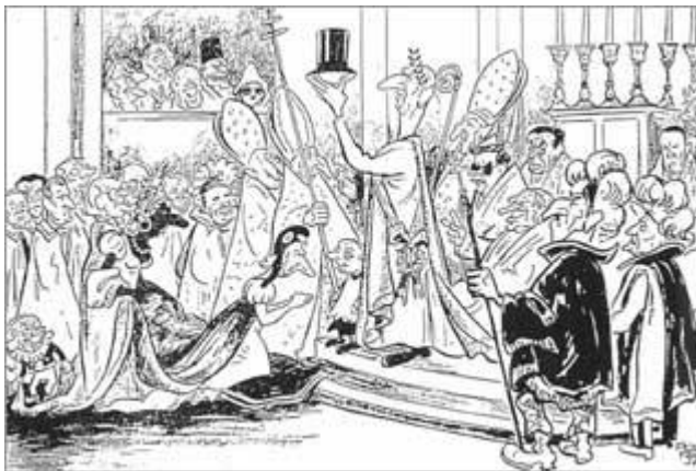
Karikatura Charlese de Gaulla od Pola Ferjaca. Kdo hádá, že se má jednat o parodii slavného obrazu Jacques-Louise Davida zachycujícího, jak Napoleon korunuje císařovnu Josefínu, hádá správně.

Tím nechci v žádném případě položit mezi oba Bonaparty a prezidenta de Gaulla rovnítko. (Ostatně, jsou zde i rozdíly – a to rozdíly ještě výraznější než souvislosti. Charles de Gaulle například nezpustošil válkou málem celou Evropu – a krom toho byl demokratem.) Nelze však pominout, že mnohé spojitosti zde skutečně existují. Tou nejmarkantnější je fakt, že žádný představitel republiky před de Gaullem nesoustředil ve svých rukou tak obrovskou moc, která by navíc i vycházela z ústavy – až právě na oba Napoleony. (Objasnit, v čem tato moc spočívala, je mimo jiné úkolem této práce.)