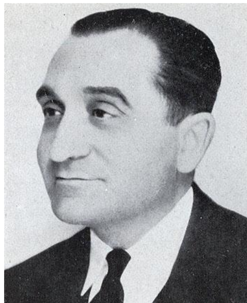
Pierre Mendès France

Roku 1923 se stal členem Radikální strany 2 , roku 1932 byl zvolen poslancem za departement Eure – ve svých pětadvaceti letech se stal vůbec nejmladším členem zákonodárského sboru. Od roku 1935 byl starostou tamějšího města Louviers.