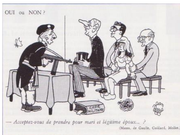
Další karikatura de Gaullova příchodu k moci. Překlad textu: ANO nebo NE? „Souhlasíte s tím vzít si za muže a zákonného manžela...?“ Generál Massu se samopalem oddává de Gaulla a Marianne (symbol republiky). Autor: Jean Effel.

Ale největší roli sehrála obrovská popularita Charlese de Gaulla. Jako národní hrdina měl nad Francouzi obrovskou moc. Lidé si dobře pamatovali, že už jednou Francii zachránil – a doufali, že to dokáže i podruhé. Většina obyvatel ho považovala za jediného člověka schopného vyřešit alžírskou krizi – to, jak a za jakou cenu to udělá, bylo v daný moment vedlejší.