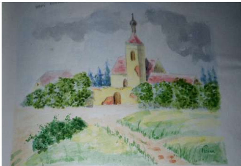
Starý mukařovský kostel – 1850