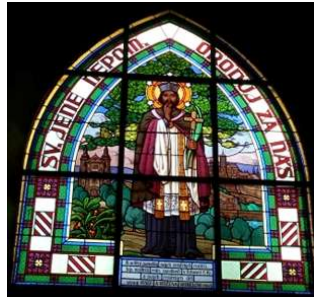
Vitráž se sv. Janem Nepomuckým, epištolní strana lodi, První okno v pohledu od předsíně

Vlevo od chórových lavic (uprostřed presbytáře) před oltářem stojí kamenný obětní stůl z roku 1993; na přední straně (tedy z pohledu věřících) je zdoben dřevěnými kružbami.