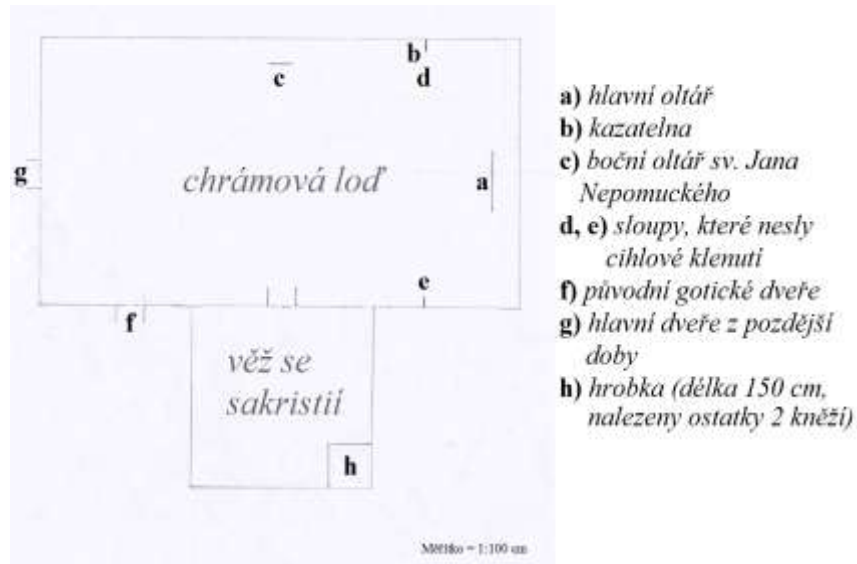
Plánek starého kostela

Nový kostel nebyl postaven na místě původního kostela, ale cca 30 metrů na východ od něj. (Starý kostel se nacházel přibližně uprostřed horní části dnešního hřbitova.) Pozemek pro nový kostel byl roku 1890 zakoupen od říčanského faráře. Náklady na výstavbu celého kostela se vyšplhaly něco málo přes 42 000 zlatých (většinu prostředků věnoval kníže Lichtenštejn). Stavba nového kostela začala roku 1890 odvozem svrchní půdy a vyzdáním základů z žernovské žuly. Na stavbě dobrovolně pracovali všichni zdejší řemeslníci. Hlavních kovářských prací se ujal kovářský mistr Otakar Nekvasil z Bud. Následujícího roku byla dokončena chrámová klenba, ukončena byla také stavba věže a na kostel byly instalovány hromosvody. Roku 1892 se začalo s výzdobou interiéru, která byla o rok později dokončena.