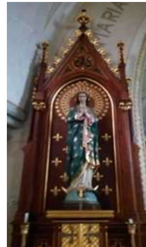
sever evangelní strany lodi