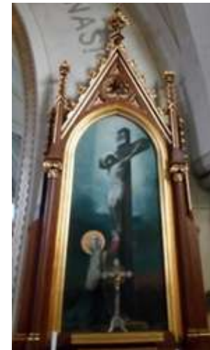
sever epištolní strany lodi