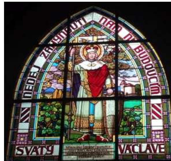
Vitráž se sv. Václavem, evangelní strana lodi, První okno v pohledu od předsíně