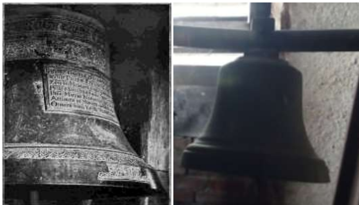
Renezanční zvon sloužící dodnes